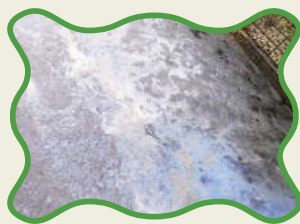
油が川に流出した場合