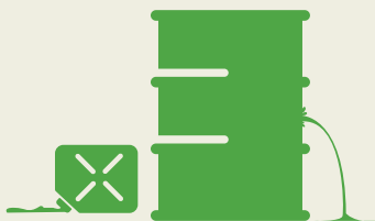
事故による油もれの対応